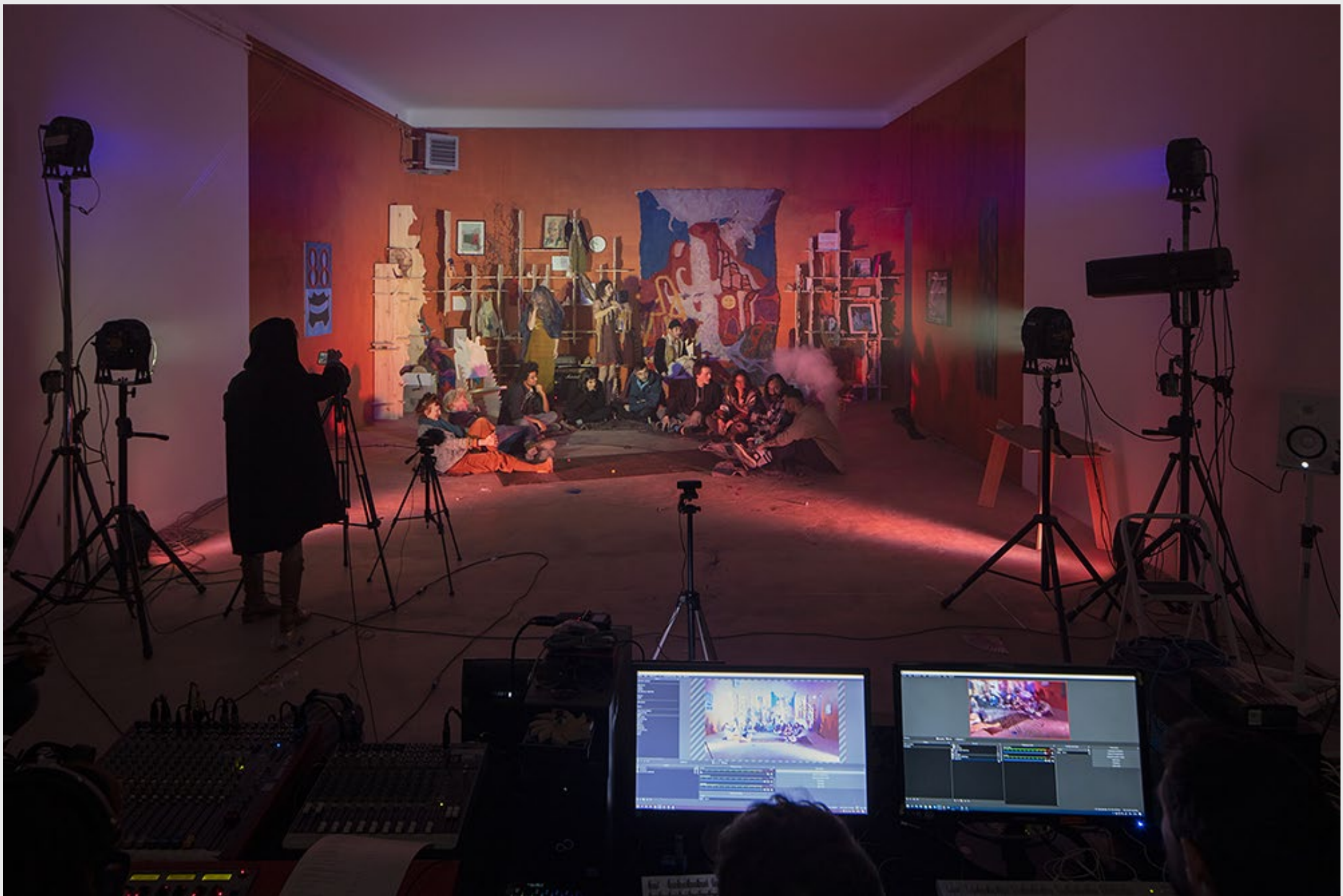
Ouverture du festival MAGMA, https://youtu.be/wN8ZvVFNQUo?t=206 , Vidéo collective en direct, jour 2, 2h29, 20 mars 2021, Cajarc, France.