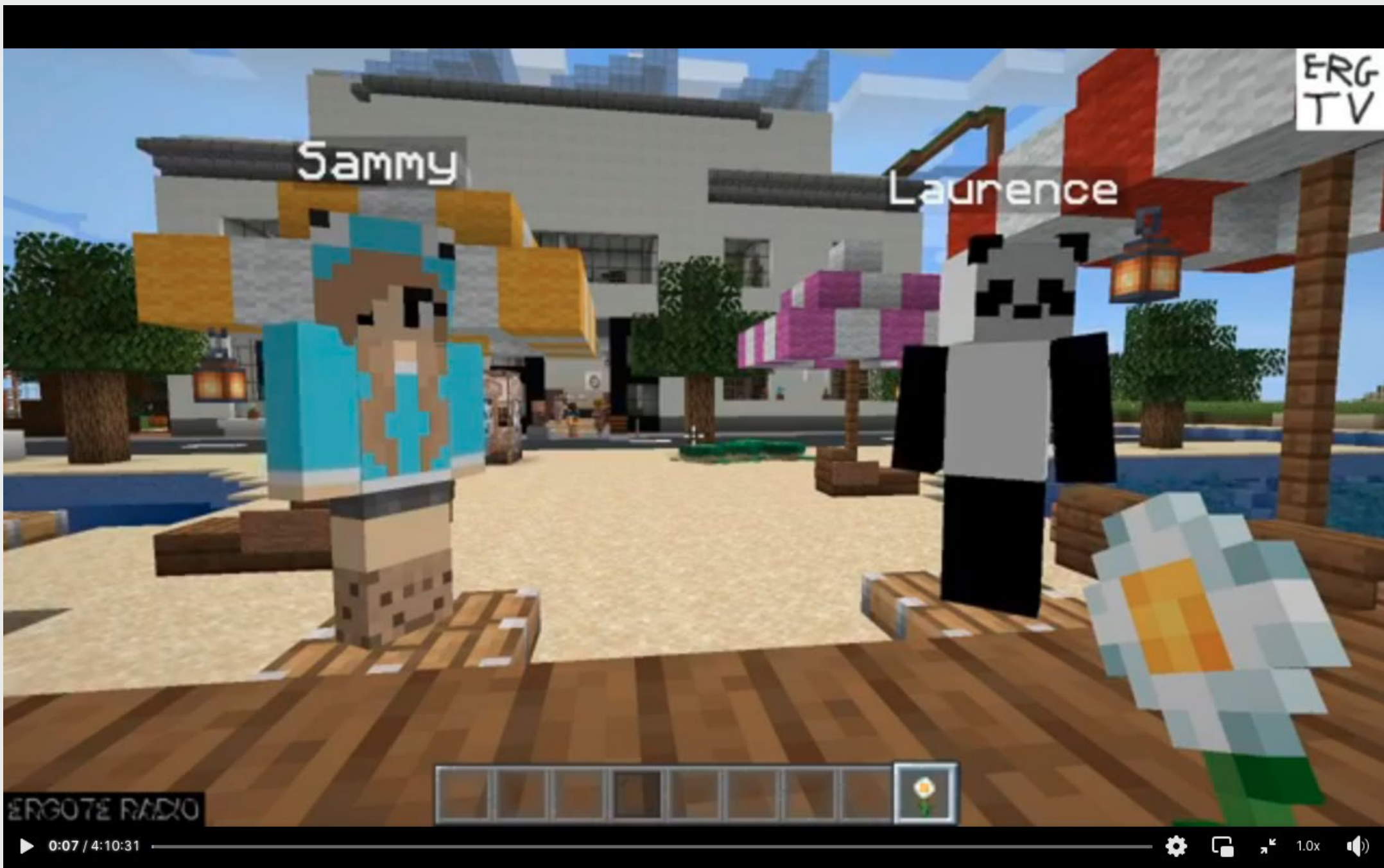
Erg 5 , https://www.facebook.com/erg.tele/videos/261637985265393 , vidéo live stream, 4h10min, 20/06/2020, portes ouvertes numériques de l'ERG, Bruxelles, sur un serveur privé Minecraft, construit pour l'occasion, et reproduisant à l'échelle 1 l'ensemble de l'école. Réalisé par ErgTv et ErgoteRadio.