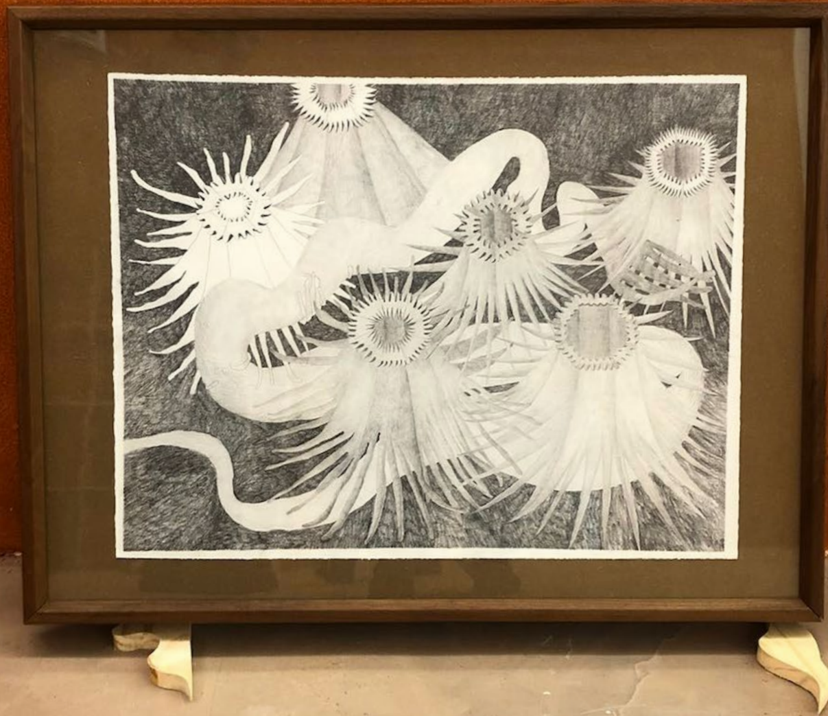
Sans titre , crayon sur papier, 50x65 cm, 2021.