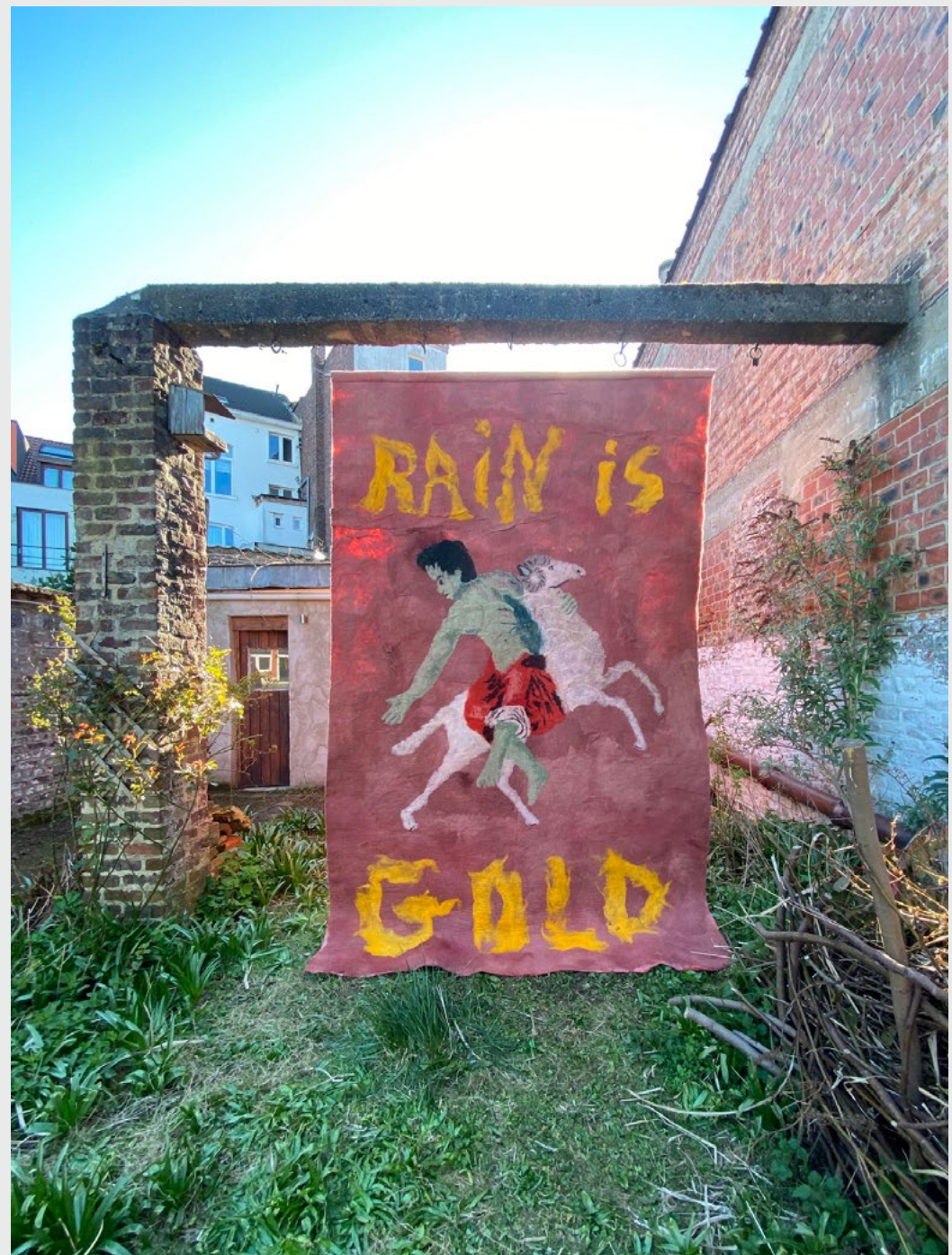
Rain is Gold, Phrixos, HELLÉ et Chrisomallos , tapisserie en feutre recto verso, 320x200 cm, 2023.