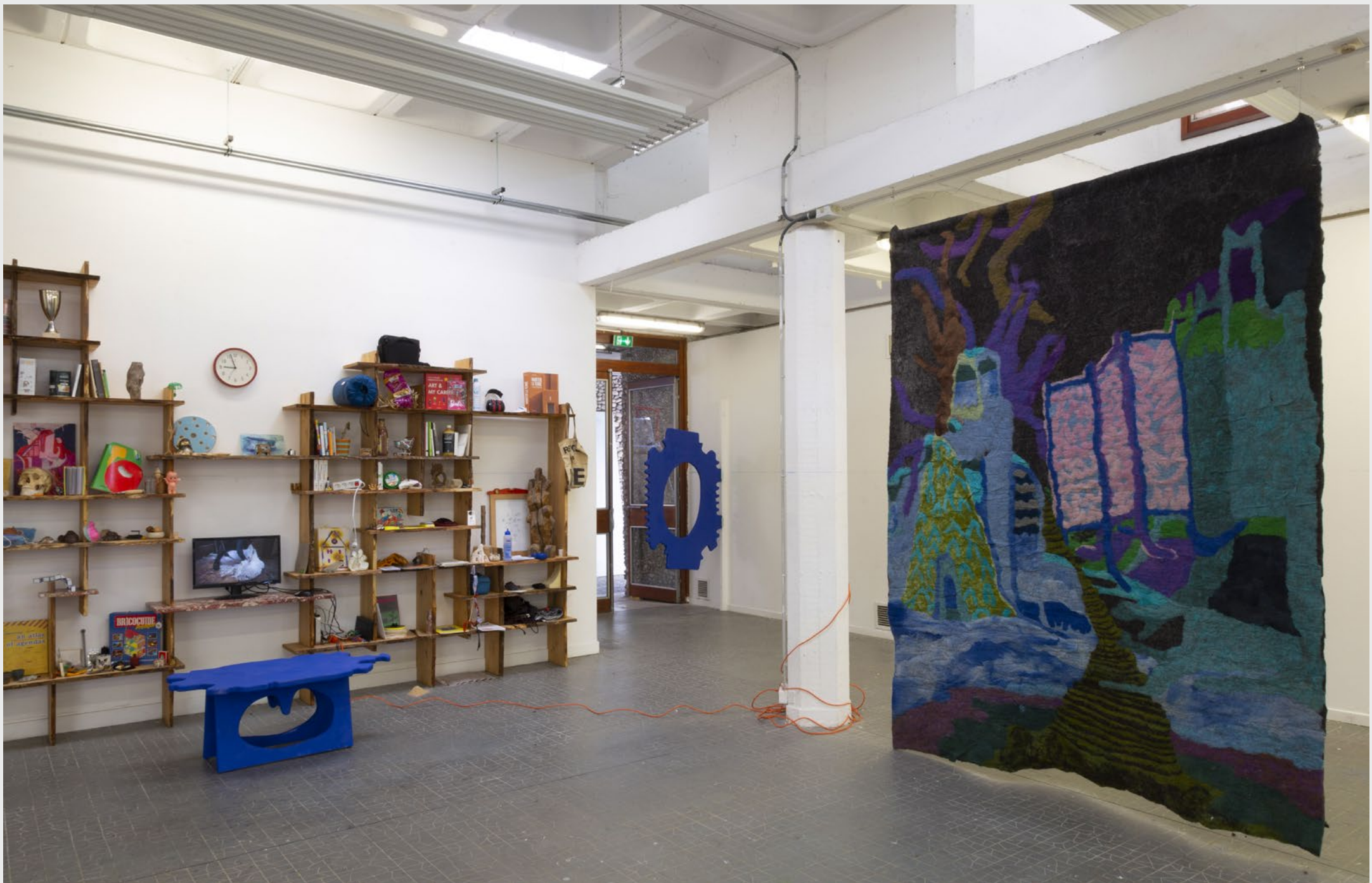
Nous n'habitons vraiment que les choses (!?), Installation de DNSEP, Villa Arson Nice, Juin 2022, Bibliothèque en châtaîgner, banc, porte, tâpissierie(s), et collection collective d'objets.