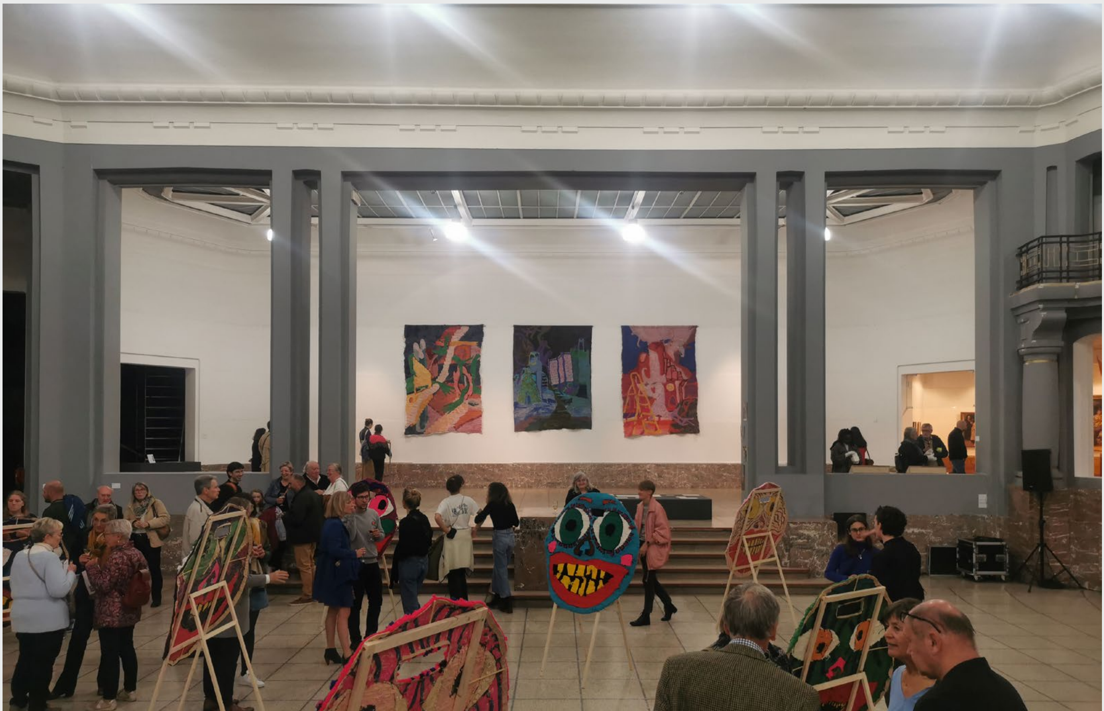
Prix Artistique de Tournai 2022 , Exposition collective des lauréats du prix, Musée des beaux-arts de Tournai, du 15 octobre au 20 novembre 2022.