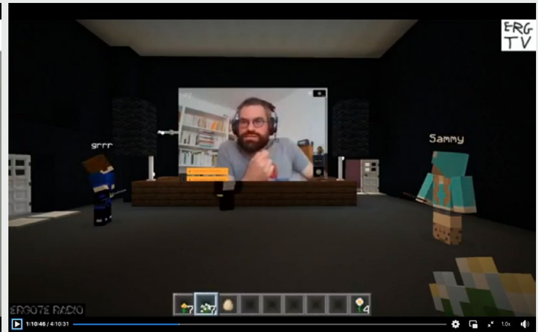
Erg 5 , https://www.facebook.com/erg.tele/videos/261637985265393 , vidéo live stream, 4h10min, 20/06/2020, portes ouvertes numériques de l'ERG, Bruxelles, sur un serveur privé Minecraft, construit pour l'occasion, et reproduisant à l'échelle 1 l'ensemble de l'école. Réalisé par ErgTv et ErgoteRadio.