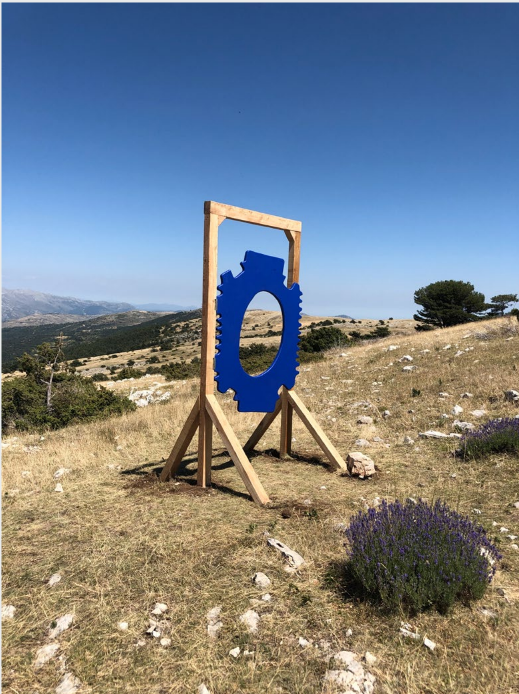
« Prière de laisser cet endroit comme vous désirez le trouver en entrant », Sculpture pour le Prix Thorenc 2022, installée sur le sommet de l'Audibergue. Porte et montants en pin et mélèze locaux, gonds va-et-vient, juin 2022.