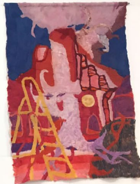
Prix Artistique de Tournai 2022 , Exposition collective des lauréats du prix, Musée des beaux-arts de Tournai, du 15 octobre au 20 novembre 2022.