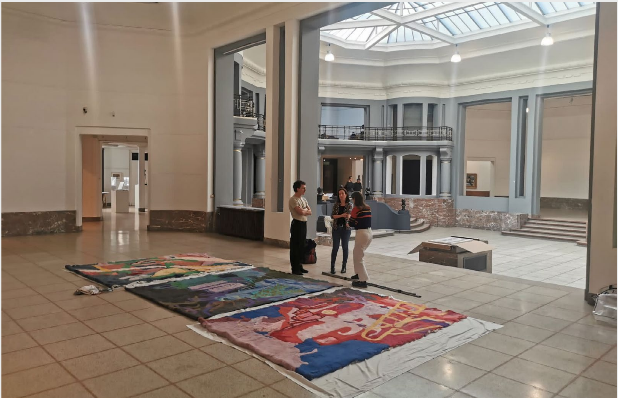
Montage pour le Prix Artistique de Tournai 2022 , Exposition collective des lauréats du prix, Musée des beaux-arts de Tournai, du 15 octobre au 20 novembre 2022.