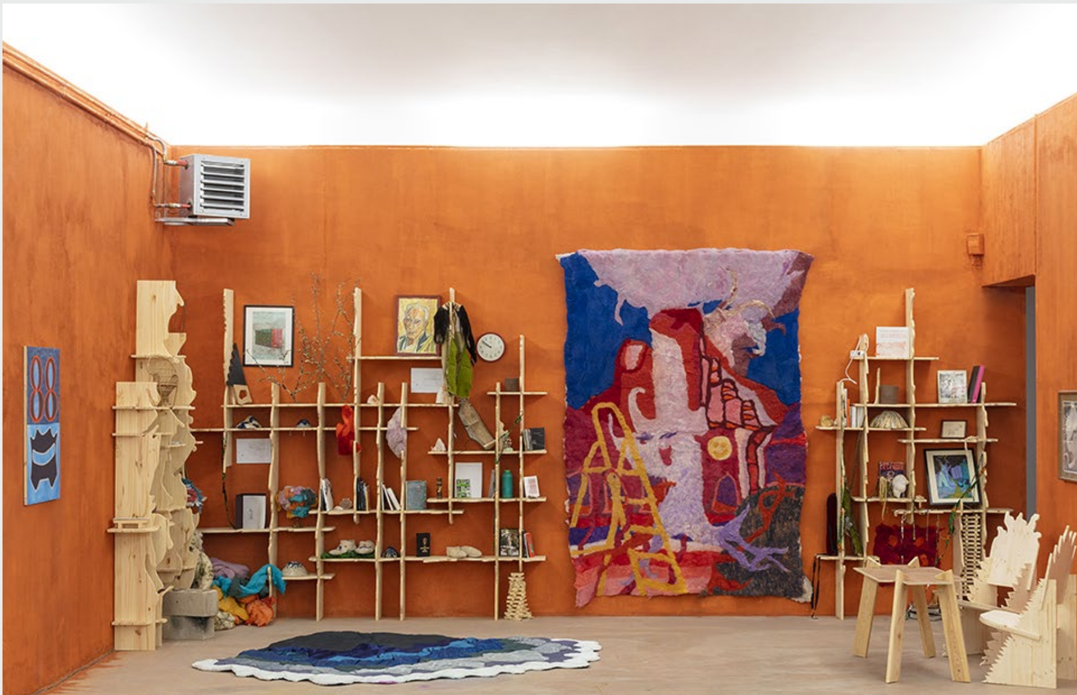
Cabinet de curiosité collectif en argile , bibliothèque, table, chaises, plâtre d'argile et collection collective d'objets, 8 x 5 x 4 m, Maison des Arts Georges et Claude Pompidou, Cajarc, mars-mai 2021. Scale for scale , tapisserie en feutre, 320x200 cm, 2021.