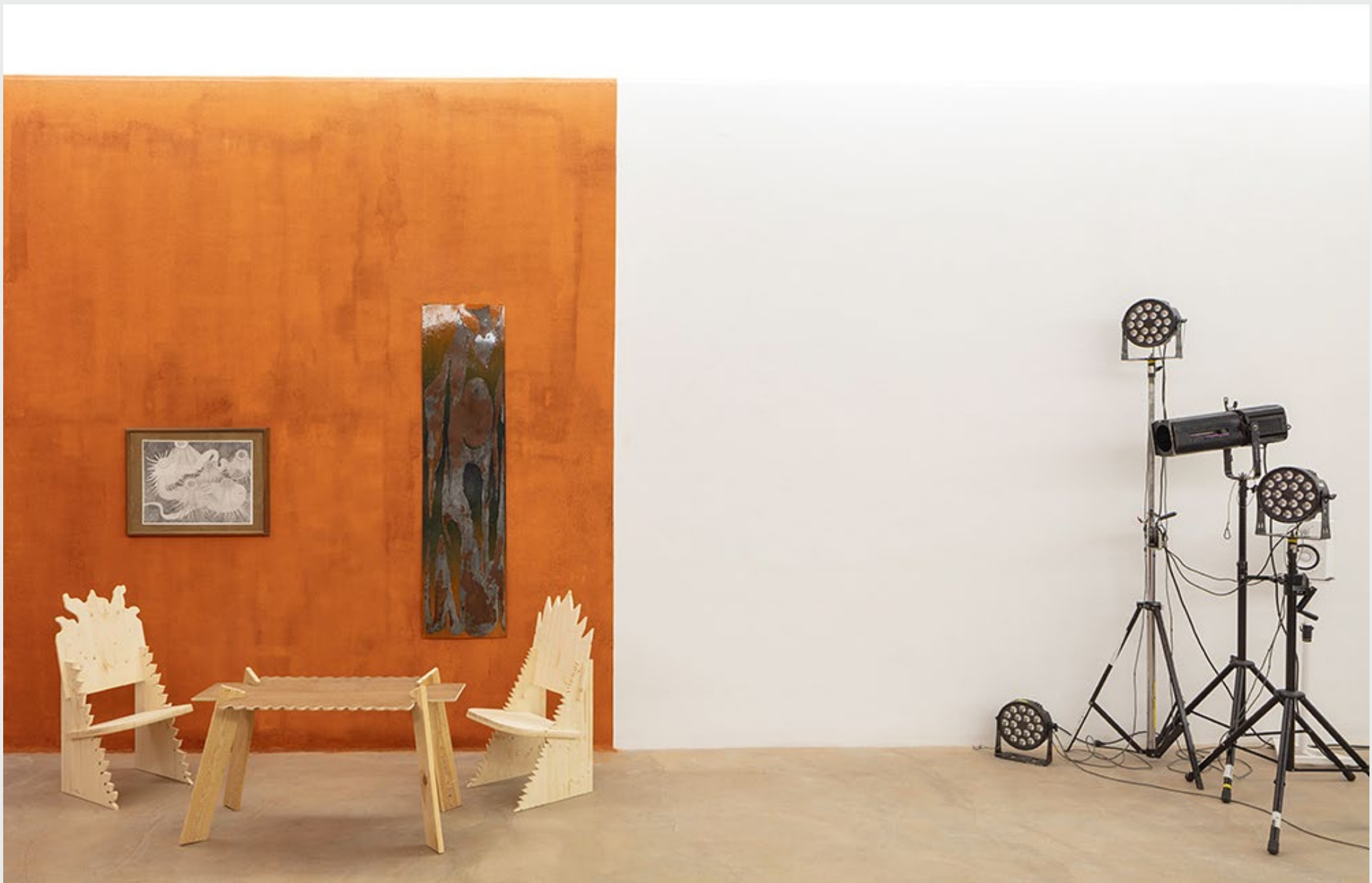
Mobilier , table et chaises, pin lamellé collé, 2021.