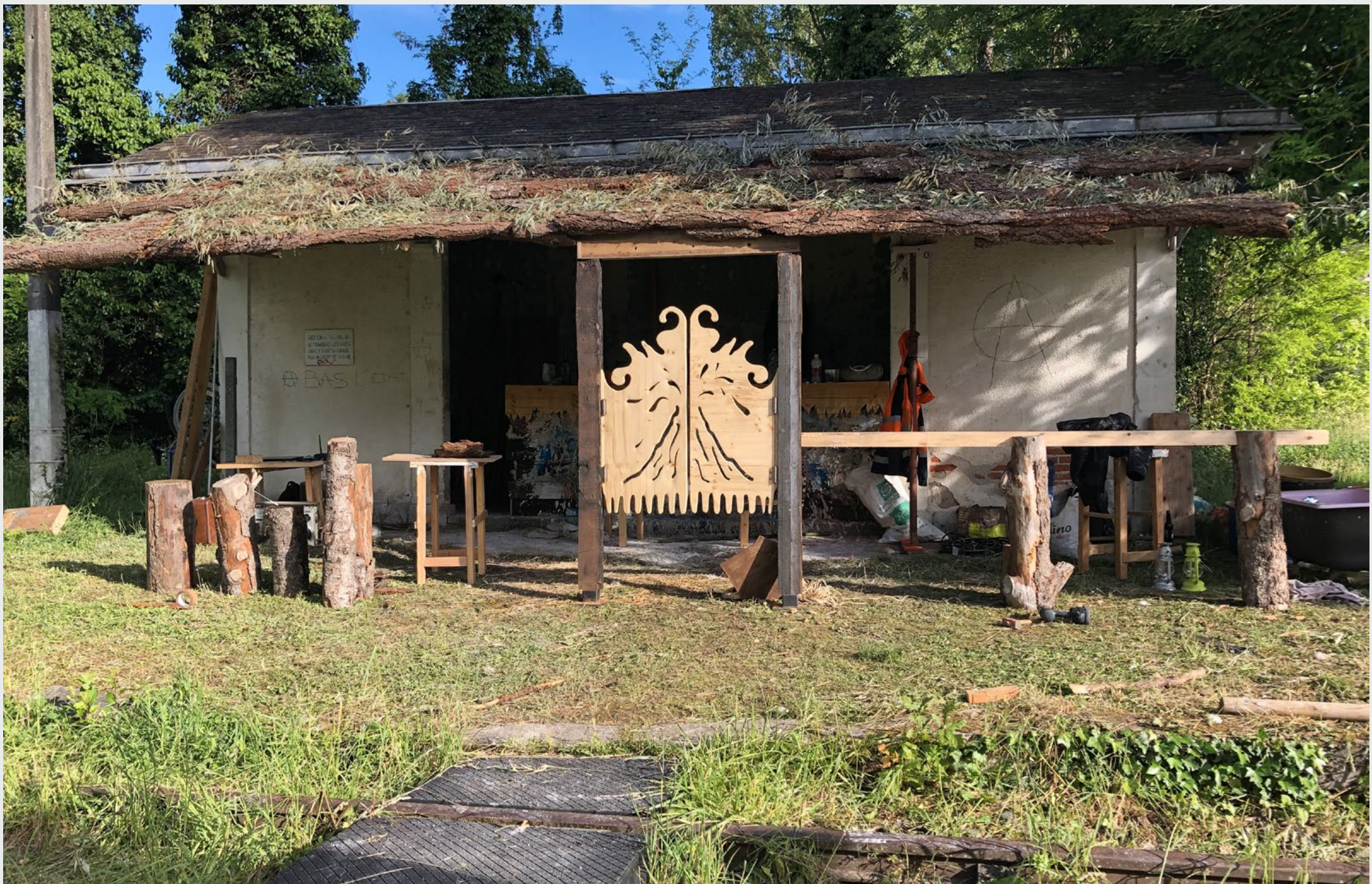
MAGMA , Porte de saloon, pin lamellé collé, 2,50 x 1 m, Week-end de cloture du Festival Magma, MAGCP Cajarc, mai 2021.