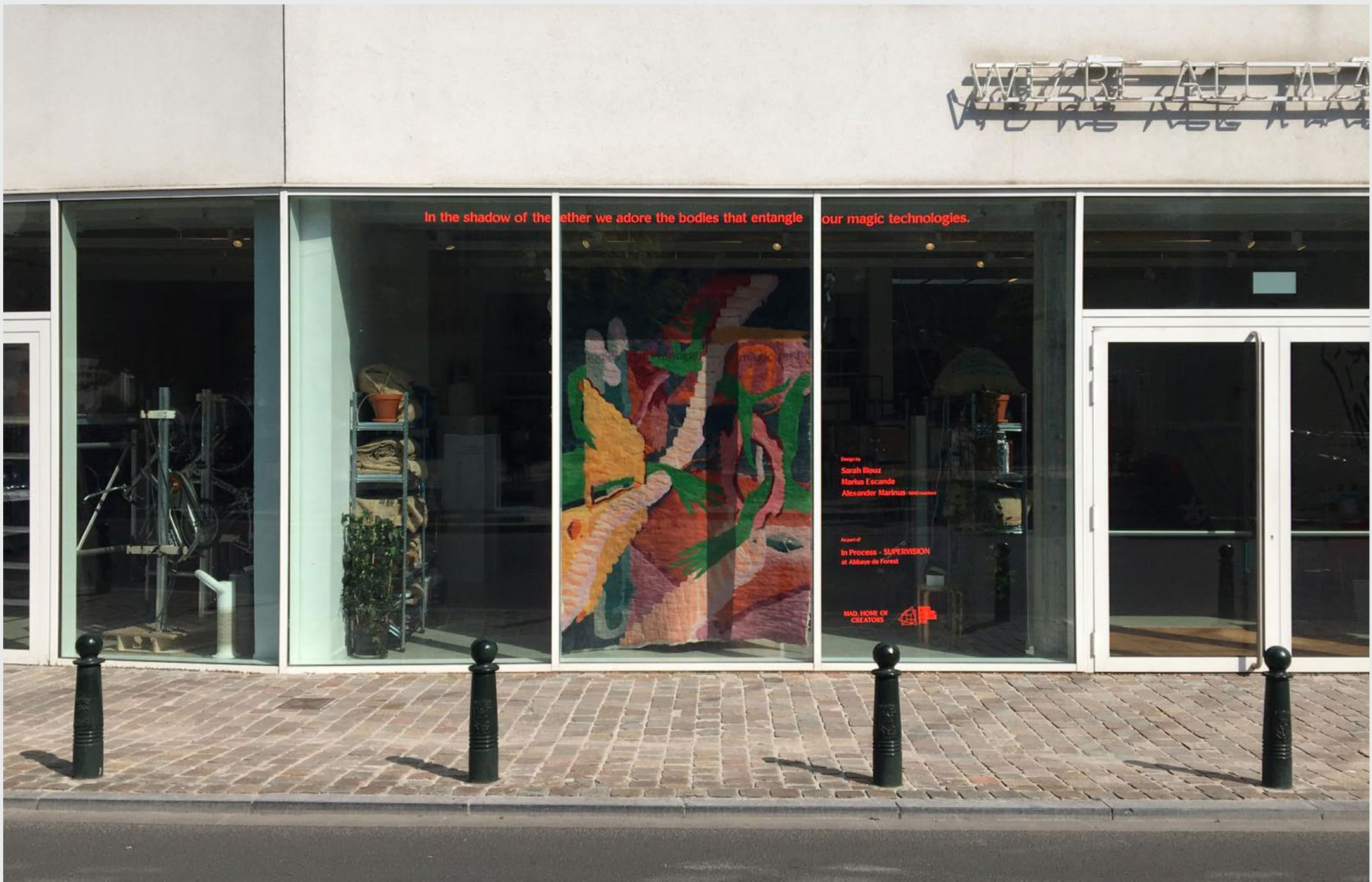
In the shadow of the ether we adore the bodies that entangle our magic technologies , tapisserie en feutre, 320x220 cm, MAD Bruxelles, Juin 2021.