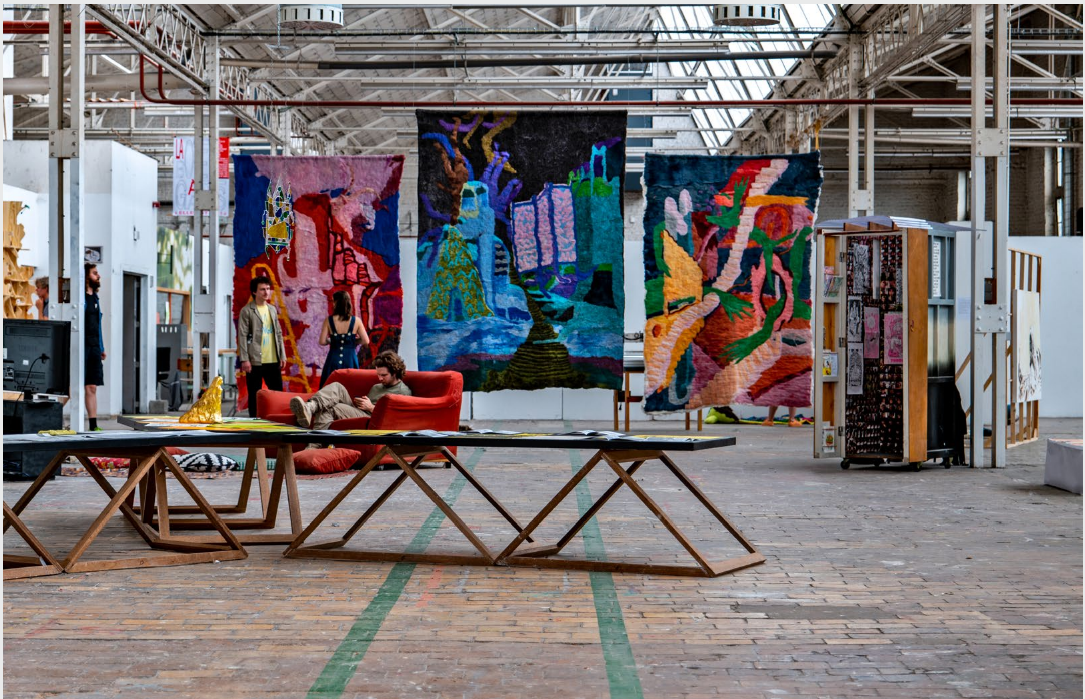
Good things take time , Installation de Jury, ERG Bruxelles, Master 2 PAOC, Juin 2022, 3 tapisseries, bibliothèque, porte de saloon, écrans, toisons de ouessant et machine à aiguilleter.